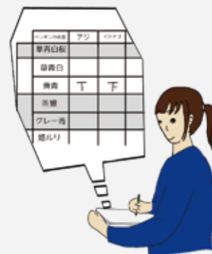
きろくしゃ 記録者