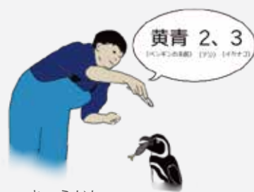
きゅうじしゃ 給餌者